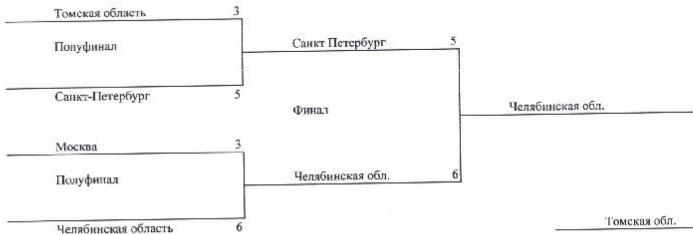
Схема плей-офф XIII Чемпионата России по спорту глухих среди мужских команд (кёрлинг)